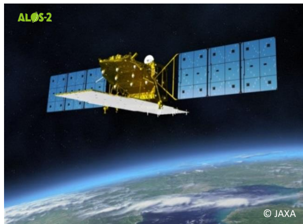
Sistema de satélite "Advanced Land Observing Satellite (ALOS-2)" da JAXXA

A Japan International Cooperation Agency (JICA) e a Japan Aerospace Exploration Agency (JAXXA) lançaram uma nova iniciativa para o aprimoramento da governança florestal em junho de 2016. Dentro de tal iniciativa, a JICA e a JAXXA desenvolvem um sistema de advertência antecipada contra o desmatamento da floresta tropical, usando o satélite denominado Advanced Land Observing Satellite (ALOS-2) da JAXXA.