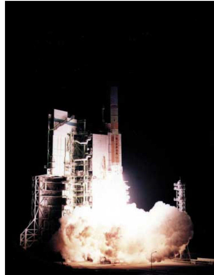
Fig.2 TRMM lifts off on board H-II Launch Vehicle No.6