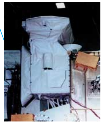
Visible Infrared Scanner (VIRS)