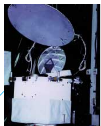
TRMM Microwave Imager (TMI)