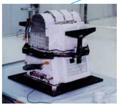
Clouds and the Earth's Radiation Energy System (CERES)