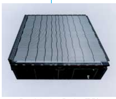
Precipitation Radar (PR)