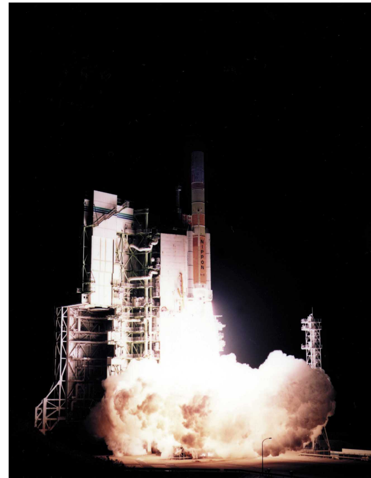
Fig.2 TRMM lifts off on board H-II Launch Vehicle No.6