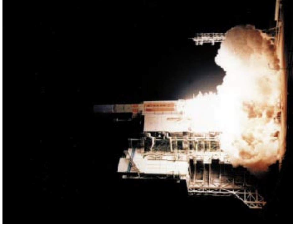
Fig.2 TRMM lifts off on board H- II Launch Vehicle No.6