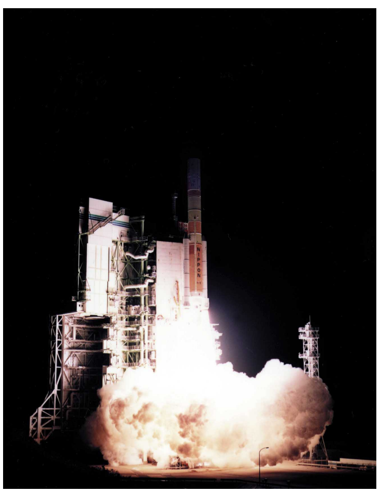
Fig.2 TRMM lifts off on board H-II Launch Vehicle No.6

Fig.1 Mating the lower fairing with TRMM